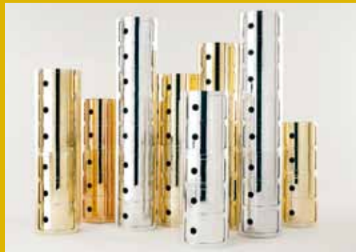
金屬質感家具是本年度的流行設計。

Masters Chair是Philippe Starck向三位二十世紀設計大師致敬之作，造型把三人的設計混為一體，售$2,080。