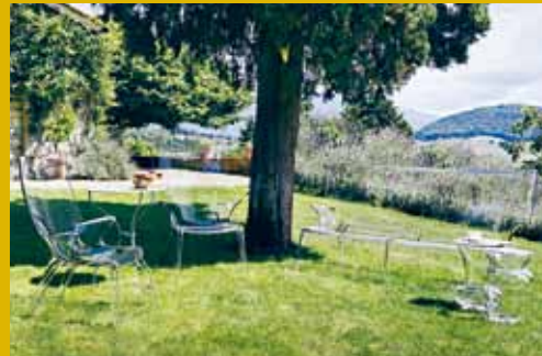
沙發精選推介單座Uncle Jim及三座位Uncle Jack，各售$4,800及$12,400。