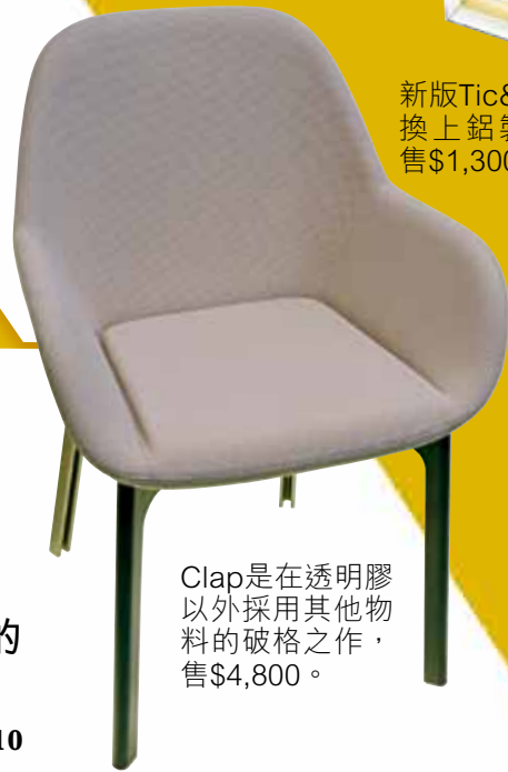
Clap是在透明膠以外採用其他物料的破格之作，售$4,800。