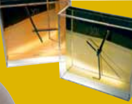
新版Tic&Tac時鐘換上鋁製指針，售$1,300。