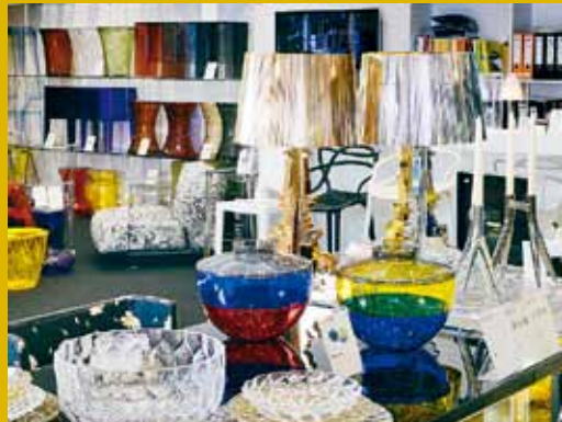
Kartell灣仔旗艦店，網羅家具、燈飾及餐具等各類精品。