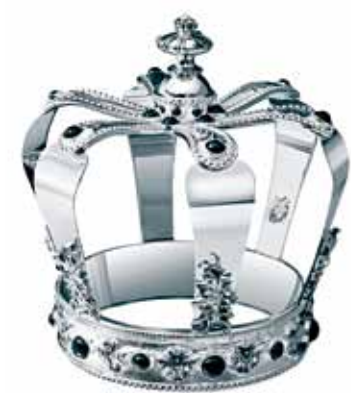
《Crowns Silver Kingdom》高24cm，全球只限量二十件，售$153,450。

有「王室御用銀器供應商」之稱的法國Christofle(昆庭)，今年跟英國設計師Martyn Lawrence Bullard合作，推出名為《Crowns Silver Kingdom》銀器創新擺設，質材為純銀鑲上黑瑪瑙，全球限量發行二十件，其中一件(編號為No.2)正於香港中環太子大廈Christofle專門店內展出，展期至今年底。查詢/ Christofle(太子大廈)/2869 7311