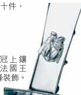
純銀皇冠上鑲有代表法國王室的蜜蜂裝飾。