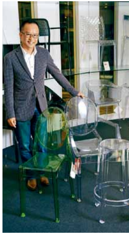
Raymond的第一把「膠」椅Louis Ghost(後)扶手椅售$2,990，還有同屬「鬼家族」的Victoria Ghost售$2,500(左)和Charles Ghost(右)售$2,100起。