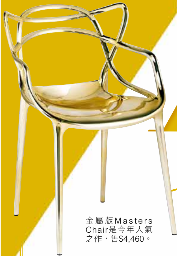
金屬版Masters Chair是今年人氣之作，售$4,460。