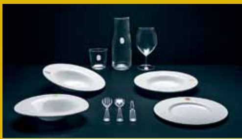
L.Dish BY D'O餐具印有設計師指模印記，售$205起。